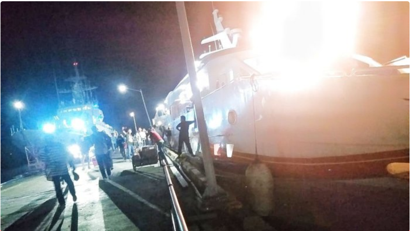
Pihak Penyidik Polda Sultra Dari Kendari Tiba Di pelabuhan Murhum Baubau. Rabu (23/08)

BAUBAU - Informasi beredar jika Pihak Polda tiba diBaubau malam ini, Rabu (23/08)